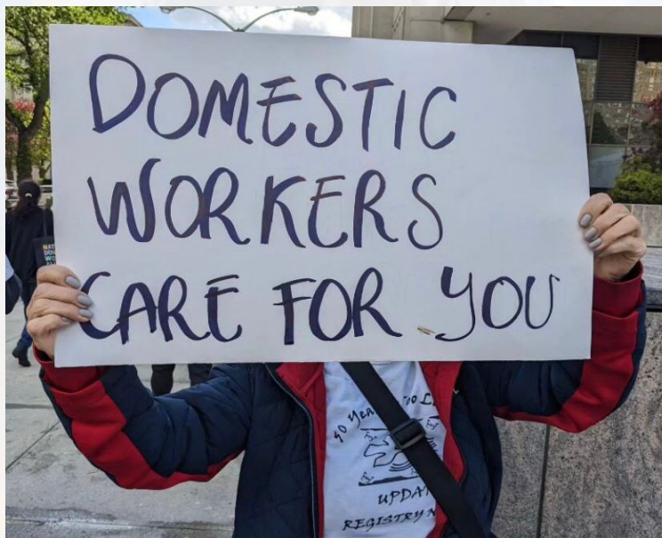
Día del Trabajador 2023.