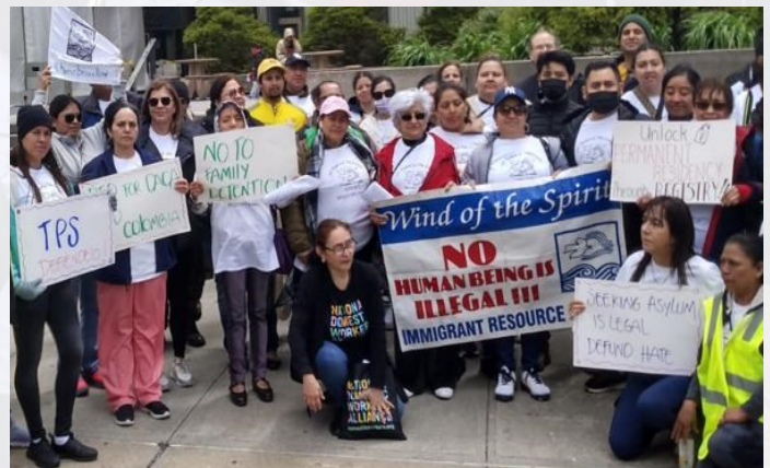
Marcha en el Día Internacional del Trabajador 2023.

En May Day 2023 se honró a los trabajadores inmigrantes como gran fuerza laboral en los Estados Unidos, pero también se denunciaron y nombraron algunas injusticias cometidas en contra de nuestra comunidad. Denunciamos las acciones inhumanas e injustas que afecta la vida laboral y calidad de vida de los inmigrantes y sus familias. Le pedimos al gobierno de Estados Unidos tomar medidas en pro de una reforma justa y humana, en nombre de la justicia, la dignidad y los derechos humanos.