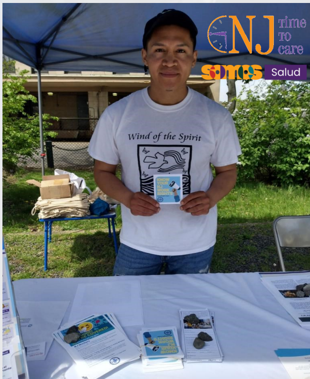
Feria de la Salud en Plainfield. Mesa informativa para los trabajadores y comunidad en general: Conozca Sus Derechos y Días de Enfermedad Pagos.

En el mes de Abril, se reconoce el Día del Trabajador Caído y el 1ro de Mayo el Día Internacional del Trabajador buscando la garantía de la salud y seguridad ocupacional, siendo de suma importancia conocer, y promover medidas de cuidado y prevención. Es importante reconocer que en Estados Unidos la fuerza laboral está significativamente representada por personas inmigrantes, en su mayoría sin estatus migratorio: dichas comunidades están más expuestas al riesgo y a los accidentes en el trabajo.