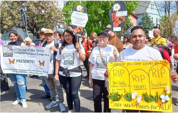
Día del Trabajador Caído.

En el mes de Abril, se reconoce el Día del Trabajador Caído y el 1ro de Mayo el Día Internacional del Trabajador buscando la garantía de la salud y seguridad ocupacional, siendo de suma importancia conocer, y promover medidas de cuidado y prevención. Es importante reconocer que en Estados Unidos la fuerza laboral está significativamente representada por personas inmigrantes, en su mayoría sin estatus migratorio: dichas comunidades están más expuestas al riesgo y a los accidentes en el trabajo.